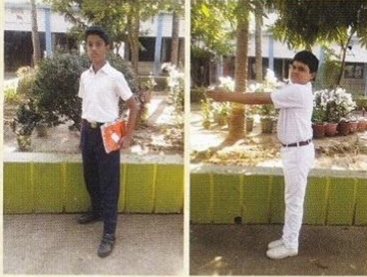
ସ୍କୁଲ ଗଣବେଶରେ ବିଦ୍ୟାର୍ଥୀ ଡ୍ରଇ ବେଶରେ ବିଦ୍ୟାର୍ଥୀ