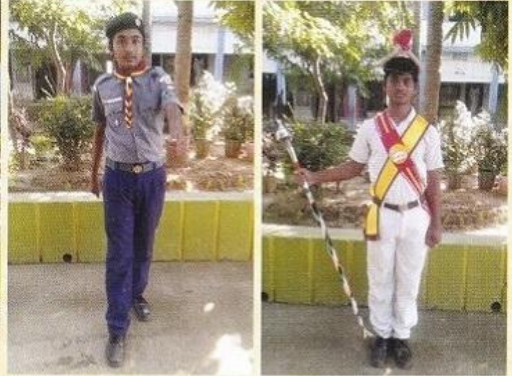
ସ୍କାଉଟ୍ ବେଶରେ ବିଦ୍ୟାର୍ଥୀ ଘୋଷ ବେଶରେ ବିଦ୍ୟାର୍ଥୀ

ବିଦ୍ୟାଳୟର ନିର୍ଦ୍ଧାରିତ ଗଣବେଶ (UNIFORM) ସହିତ ଛାତ୍ରାବାସ ପାଇଁ ଆବଶ୍ୟକ ଲୁଗାପଟା ଏବଂ ଅନ୍ୟାନ୍ୟ ଜିନିଷର ତାଲିକା ନିମ୍ନରେ ପ୍ରଦାନ କରାଯାଇଛି -